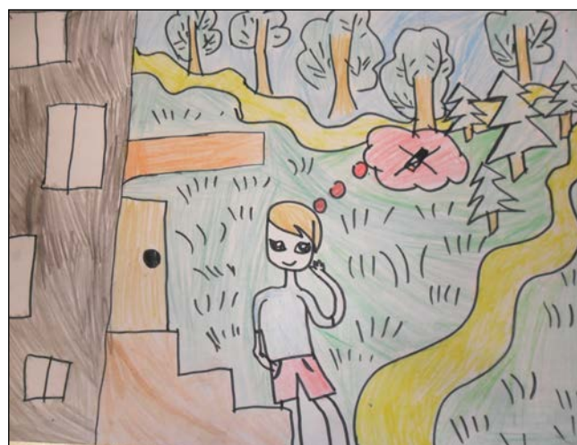
Рисунок Максим Михайлов, 6А класс