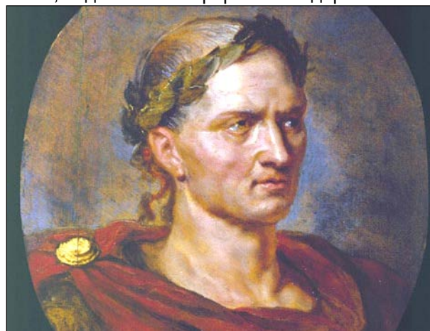
Гай Юлий Цезарь

Считалось, что в этот день рождаются избранные. Некие посланники из параллельного мира. В древности эти люди считались прирожденными Магами, наделенными пророческим даром.