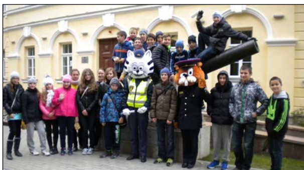
6В класс знакомится с работой полицейских