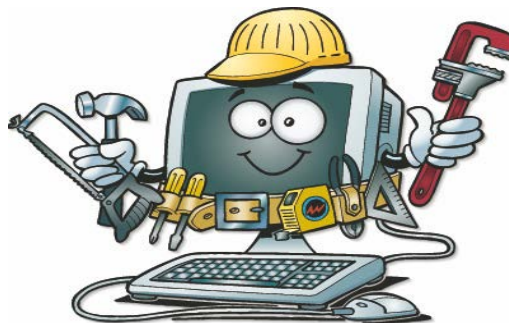
О безопасном интернете. Стр.6.