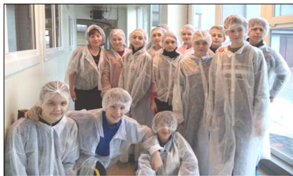
Об экскурсии в Лачи. Стр.4.