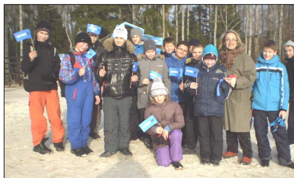
О 5А классе. Стр.5.