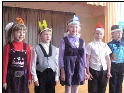
Праздник Букваря. Стр. 4