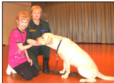
Необычные гости. Стр. 2