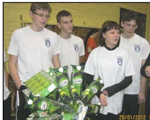
Конкурсы, конкурсы... Стр. 3