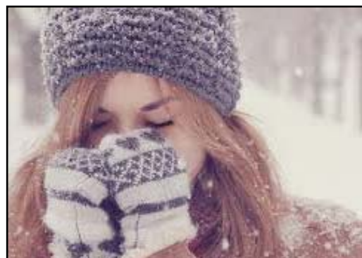
Будьте здоровы. Стр. 7