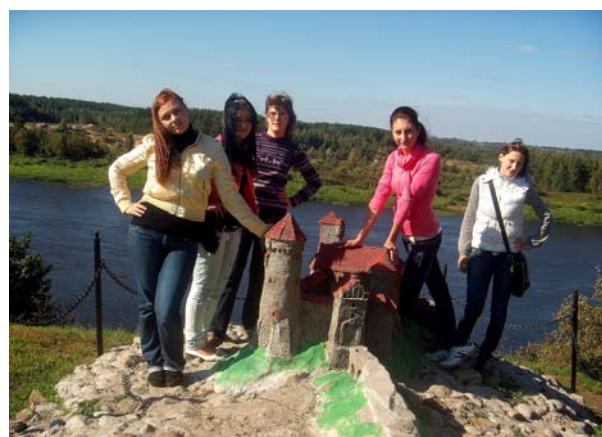
Поход за историей (11В)