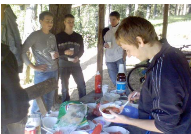
На природе всё вкуснее (12 А)