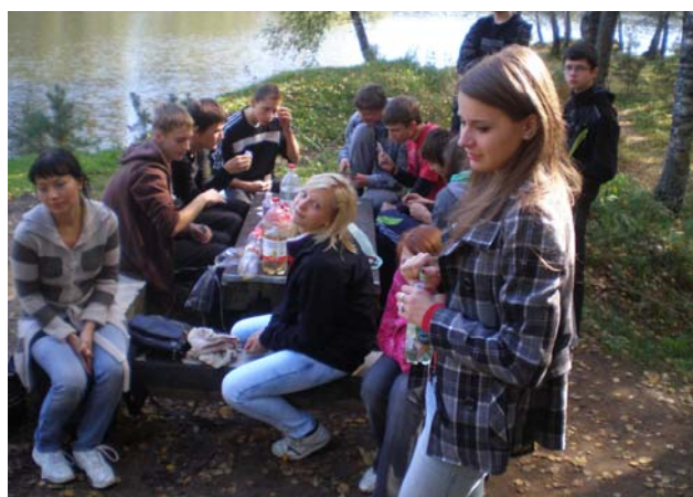
Как здесь хорошо! (9 А)