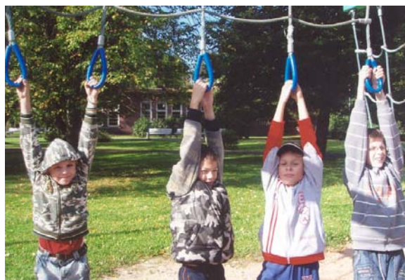
Будущие ученики профессионального класса (5 D)