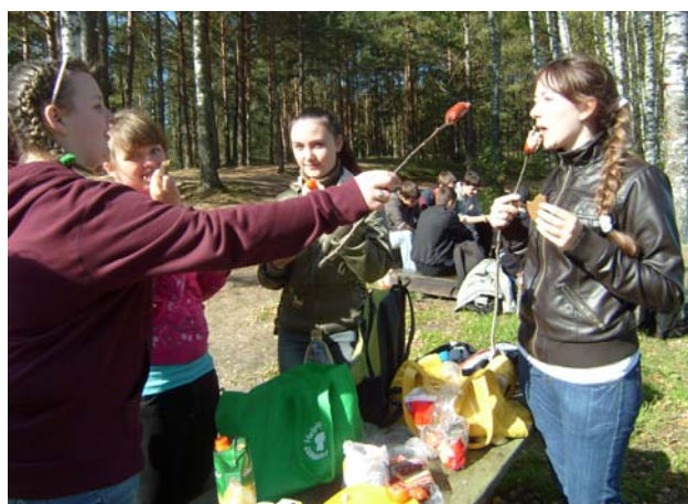
У нас сегодня зверский аппетит (9 С)